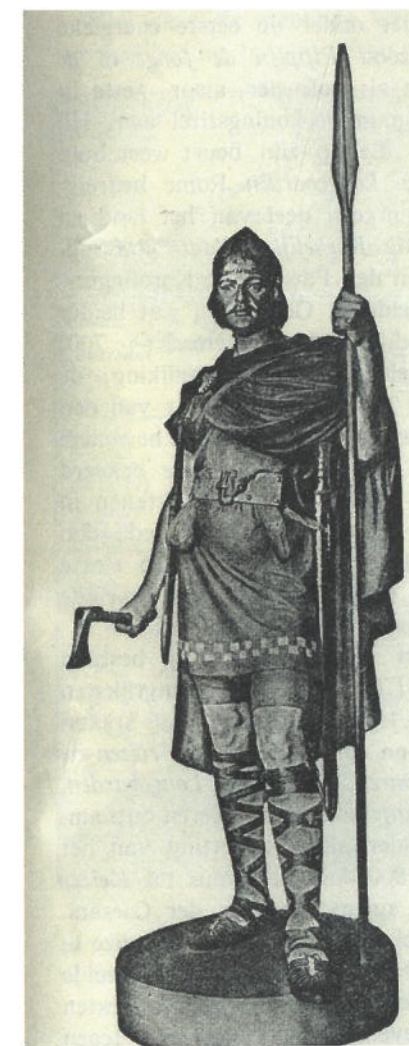
FRANKISCH SOLDAAT. In: E. Rijpma, Ontwikkelingsgang der Historie. Geïllustreerde beknopte Algemeene en vaderlandse Geschiedenis Deel I. Oudheid en Middeleeuwen (Groningen ca. 1943). Collectie Nationaal Onderwijsmuseum