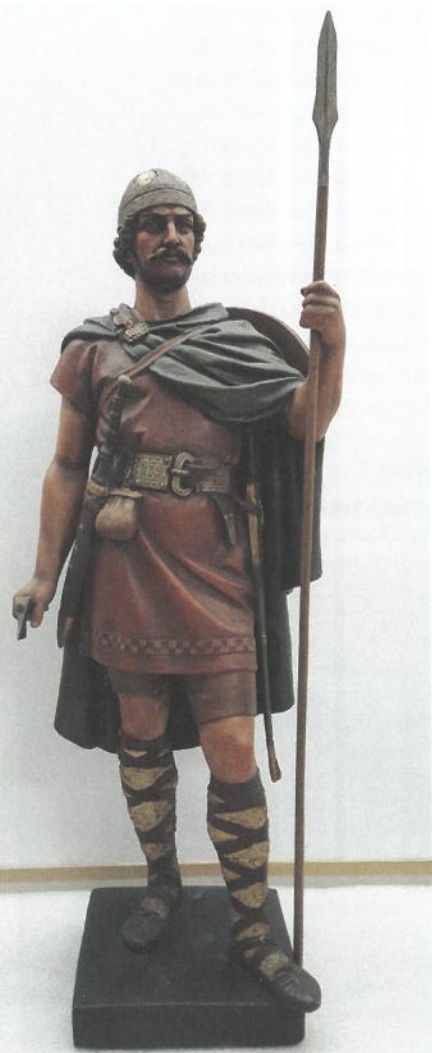
Model van Frankische soldaat, gips, gekleurd, 59 cm (voor 1906). Het Rijksmuseum van Oudheden kocht het beeld in 1906 van het Römisch-Germanische Zentralmuseum in Mainz. Rijksmuseum van Oudheden, Leiden

Van de onderzochte leerboekenseries is er één uitzondering op de tot nu toe gedane constatering. De auteurs van Toen ... En Nu! (1923) hebben de illustratie