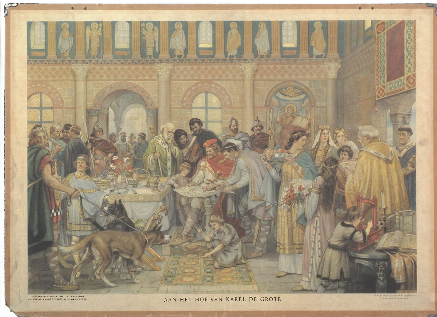
AAN HET HOF VAN KAREL DE GROTE